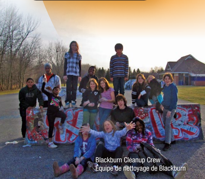
Blackburn Cleanup Crew Équipe de nettoyage de Blackburn