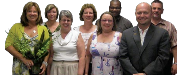
E.D. et Conseil d'administration