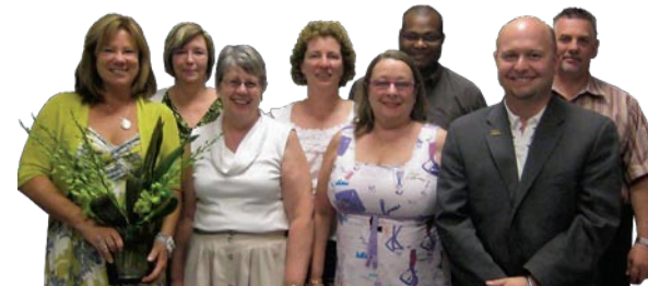
E.D. and Board of Directors