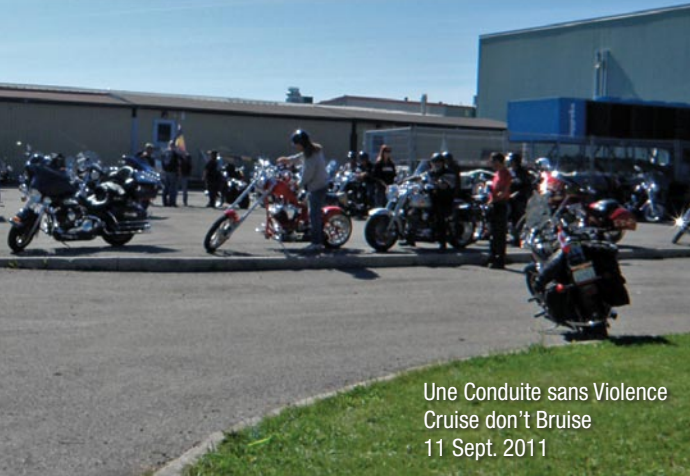
Une Conduite sans Violence Cruise don't Bruise 11 Sept. 2011