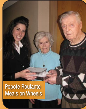
Popote Roulante Meals on Wheels