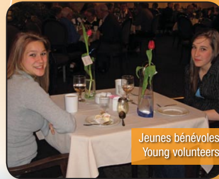
Jeunes bénévoles Young volunteers