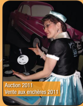
Auction 2011 Vente aux enchères 2011